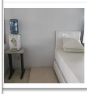
Fasilitas Ruang Istirahat

Truck Center dilengkapi dengan fasilitas ruang tunggu nyaman, kamar tidur, dan kamar mandi sehingga para supir dapat tetap beristirahat ketika kendaraannya diperbaiki.