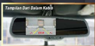
Tampilan Dari Dalam Kabin

Memudahkan pengemudi melihat area belakang melalui spion tengah saat mundur.