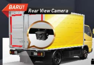
BARU! Rear View Camera