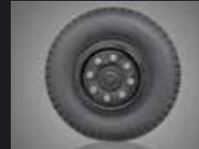
Ban 10.00-20-16 PR