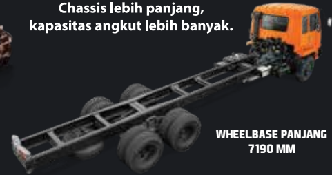
WHEELBASE PANJANG 7190 MM

Chassis lebih panjang, kapasitas angkut lebih banyak.