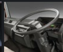
Power Steering + Tilt Steering