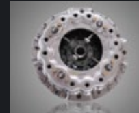
Clutch Disc 38 cm