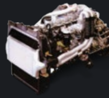
MESIN 6D16-3AT2 TURBO INTERCOOLER Irit bertanaga tahan lama

Chassis lebih panjang, kapasitas angkut lebih banyak.