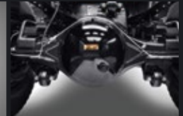
Final Gear Ratio