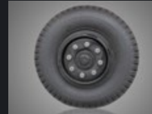
Ban 10.00 - 20 16 PR