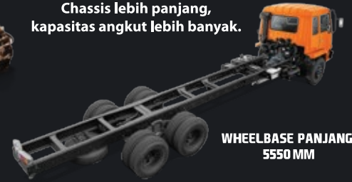
WHEELBASE PANJANG 5550 MM

Chassis lebih panjang, kapasitas angkut lebih banyak.