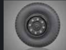
Ban 10.00-20-16 PR