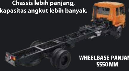
WHEELBASE PANJANG 5550 MM

Chassis lebih panjang, kapasitas angkut lebih banyak.