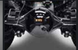
Final Gear Ratio