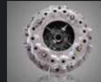
Clutch Disc 38 cm