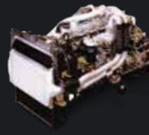
MESIN 6D16-3AT2 TURBO INTERCOOLER Irit bertengaga tahan lama

Chassis lebih panjang, kapasitas angkut lebih banyak.