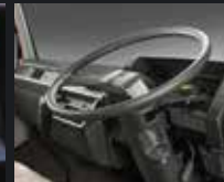
Power Steering + Tilt Steering