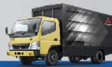
Wing Box Aluminium