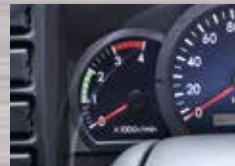
Tachometer Mempermudah penyetaraan putaran mesin dengan kecepatan kendaraan, agar irit BBM.