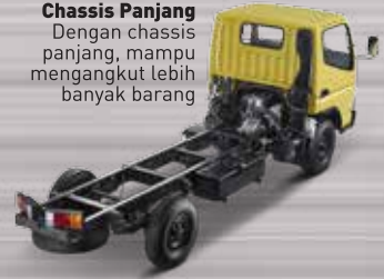
Chassis Panjang Dengan chassis panjang, mampu mengangkut lebih banyak barang