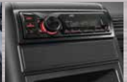
Radio/USB/MP3 Menambah kenyamanan di sepanjang perjalanan.