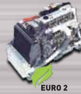
MESIN 4D34-2AT5 TURBO INTERCOOLER Irit bertenaga tahan lama