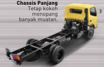
Chassis Panjang Tetap kokoh menopang banyak muatan.