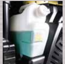
Tangki Radiator Posisi di bagian luar sehingga mudah dikontrol.