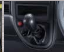
Mitsubishi In Dash Gear Shift Tuas transmisi menyatu dengan dashboard, kabin lega.