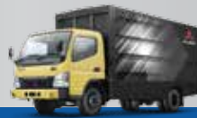
Wing Box Aluminium