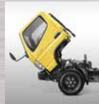
Kabin Jungkit Mudah dalam pemeriksaan dan perawatan mesin.