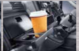
Cup Holder Memudahkan pengemudi meletakkan minuman, agar tak mudah tumpah.