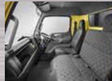
Kabin Ekstra Lega Pengemudi lebih leluasa untuk melakukan perjalanan jarak jauh.