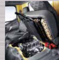
Inspection Lid Berada di bawah jok penumpang, pengecekan mesin lebih mudah.