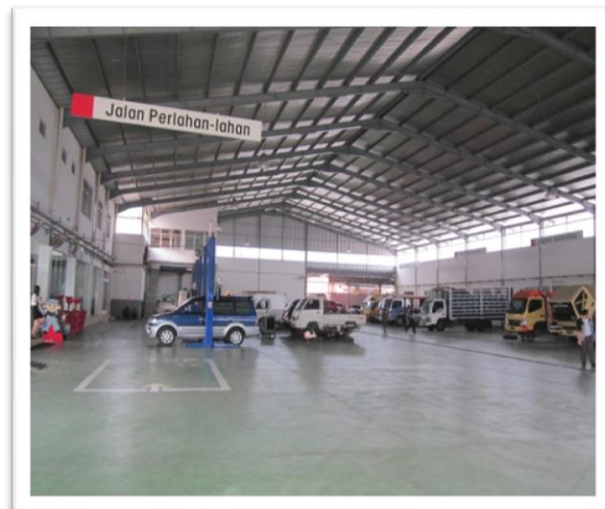
Workshop Truck Center PT. Suryaputra Sarana, Bandung