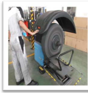
Truck Wheel Balancer

Disini juga tersedia Parts Depo yang merupakan gudang-gudang kecil berukuran 40 feet yang berfungsi sebagai tempat penyimpanan \pm 700 spare parts berstatus fast moving dan slow moving parts sehingga memudahkan ketersediaan spare parts di dealer-dealer resmi Mitsubishi.