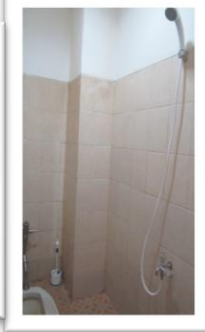
Fasilitas Ruang Istirahat